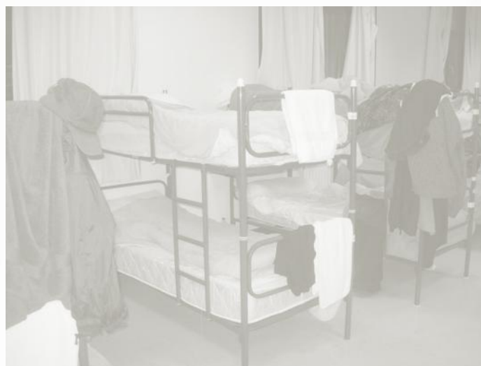
Recursos / servicios