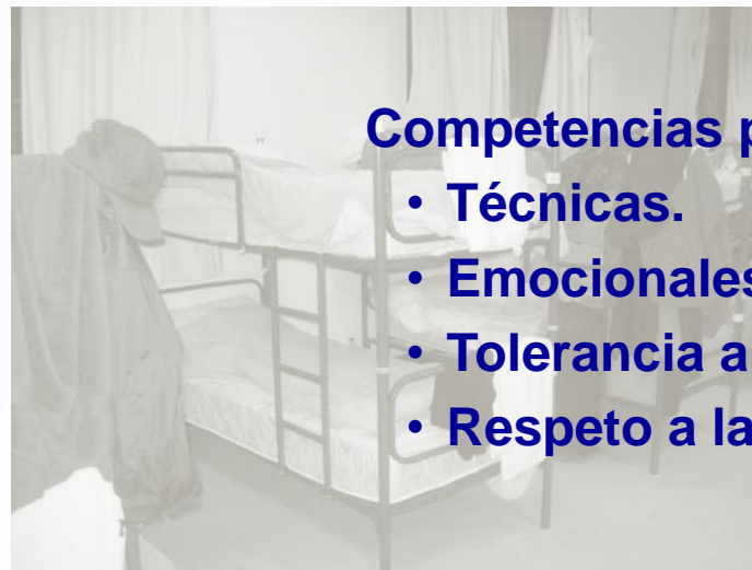
Recursos / servicios