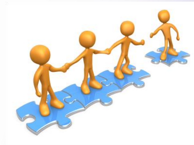
Modo de intervenir