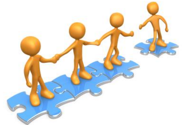
Modo de intervenir