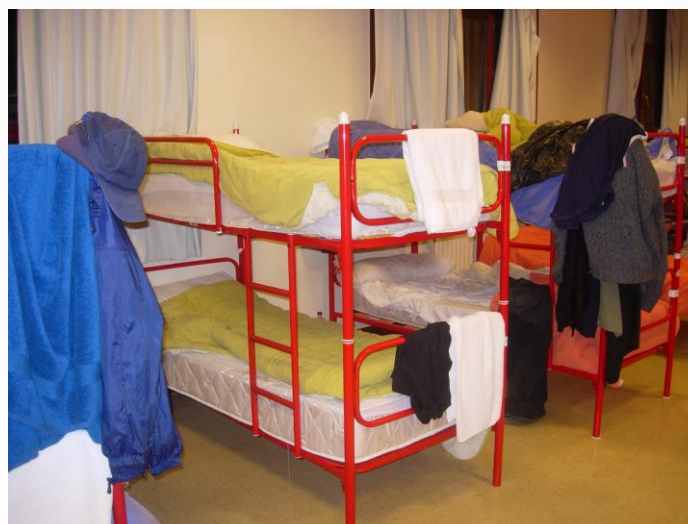
Recursos / servicios